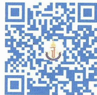
กรอกข้อมูลสัญญาการเป็นนักเรียน ฯ