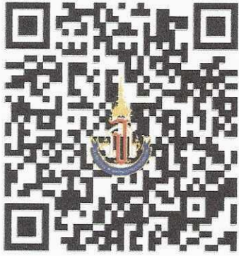
ช่องทางรายงานตัวและยืนยันสิทธิ์

สแกน QR Code เพื่อการรายงานตัวยืนยันสิทธิ์การเข้าเรียน โรงเรียนวิทยาศาสตร์จุฬาราชวิทยาลัย สตูล ชั้นมัธยมศึกษาปีที่ 1 ปีการศึกษา 2568