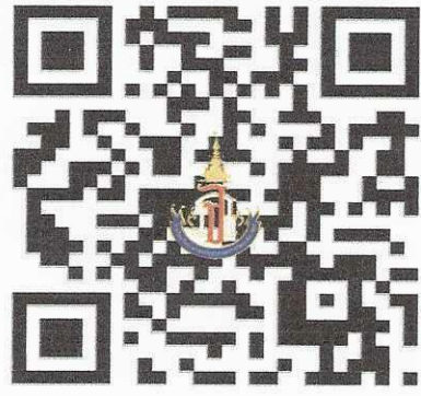
แบบรายงานตัวยืนยันสิทธิ์หรือสละสิทธิ์

สแกน QR Code เพื่อการรายงานตัวยืนยันสิทธิ์การเข้าเรียน โรงเรียนวิทยาศาสตร์จุฬาราชวิทยาลัย สตูล ชั้นมัธยมศึกษาปีที่ 1 ปีการศึกษา 2568