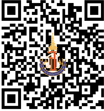
ช่องทางรายงานตัวและยืนยันสิทธิ์

สแกน QR Code เพื่อการรายงานตัวยืนยันสิทธิ์การเข้าเรียน โรงเรียนวิทยาศาสตร์จุฬาราชวิทยาลัย สตุล ชั้นมัธยมศึกษาปีที่ 1 ปีการศึกษา 2568