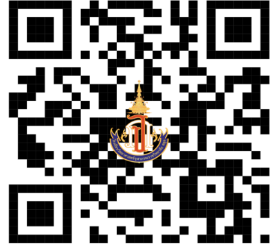
แบบรายงานตัวยืนยันสิทธิ์หรือสละสิทธิ์

สแกน QR Code เพื่อการรายงานตัวยืนยันสิทธิ์การเข้าเรียน โรงเรียนวิทยาศาสตร์จุฬาราชวิทยาลัย สตุล ชั้นมัธยมศึกษาปีที่ 1 ปีการศึกษา 2568