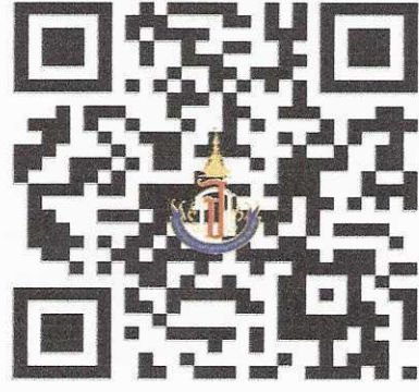
แบบรายงานตัวยืนยันสิทธิ์หรือสละสิทธิ์

สแกน QR Code เพื่อการรายงานตัวยืนยันสิทธิ์การเข้าเรียน โรงเรียนวิทยาศาสตร์จุฬารณราชวิทยาลัย สตูล ชั้นมัธยมศึกษาปีที่ 1 ปีการศึกษา 2568