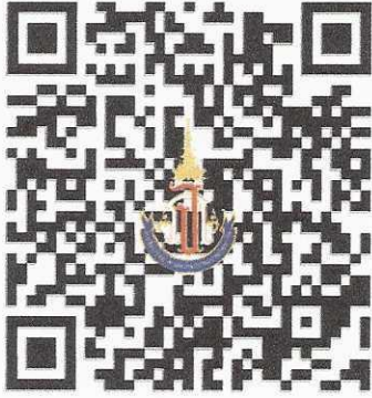
ช่องทางรายงานตัวและยืนยันสิทธิ์

สแกน QR Code เพื่อการรายงานตัวยืนยันสิทธิ์การเข้าเรียน โรงเรียนวิทยาศาสตร์จุฬารณราชวิทยาลัย สตูล ชั้นมัธยมศึกษาปีที่ 1 ปีการศึกษา 2568