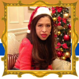
ทรงพระเจริญ