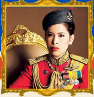
ทรงพระเจริญ